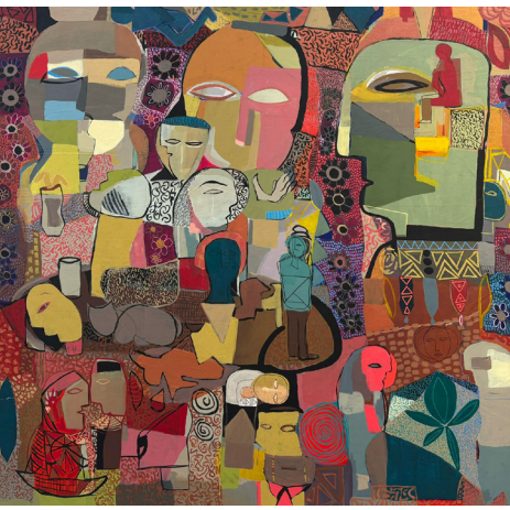
حوار عائلي Family Dialogue 200x170 CM Acrylic on Canvas أكريلك على قماش