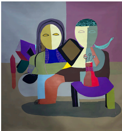
Family & a Bird عائلة و طير 130x130 CM Acrylic on Canvas أكريلك على قماش