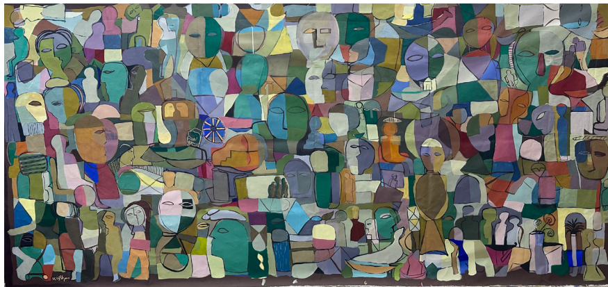
Mural جدارية 156x310 CM Acrylic on Canvas أكريلك على قماش