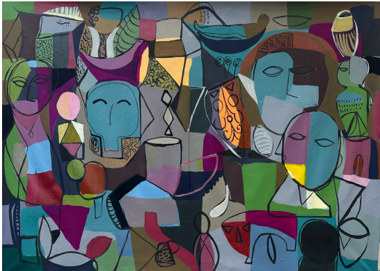
House بيت 125x80 CM Acrylic on Canvas أكريلك على قماش