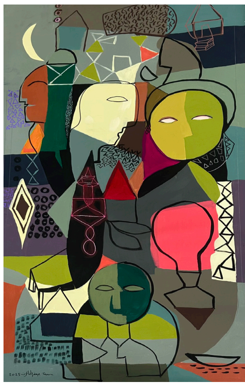
خمسة أشخاص Five people 130 x 70 CM Acrylic on Canvas أكريلك على قماش