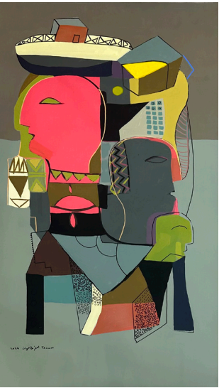
House in a Basket بيت في سلة 70x130 CM Acrylic on Canvas أكريلك على قماش