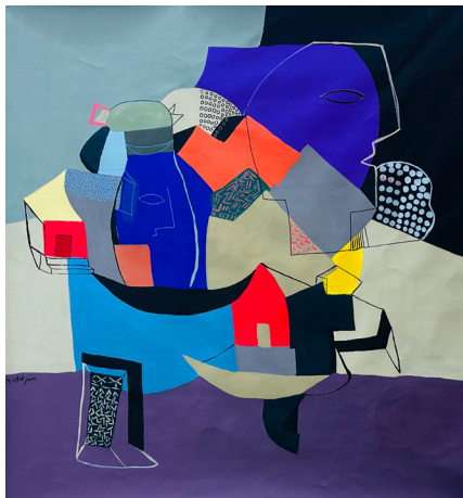
Glimmers of a Home ومضات بيت 130x130 CM Acrylic on Canvas أكريلك على قماش