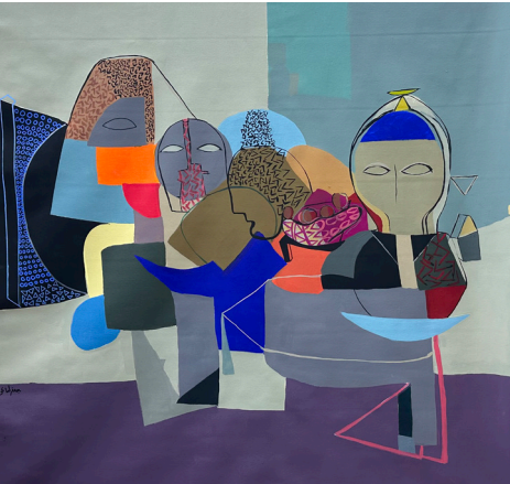
وجه Face 130x130 CM Acrylic on Canvas أكريلك على قماش