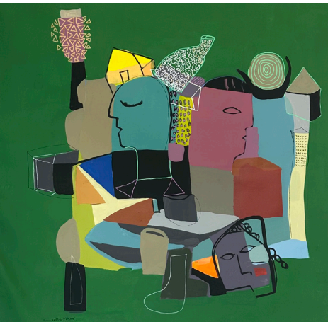
بدون عنوان Untitled 100x105 CM Acrylic on Canvas أكريلك على قماش