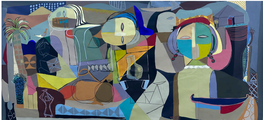
نخلة وذاكرة A Palm Tree & Memory 106x206 CM Acrylic on Canvas أكريلك على قماش