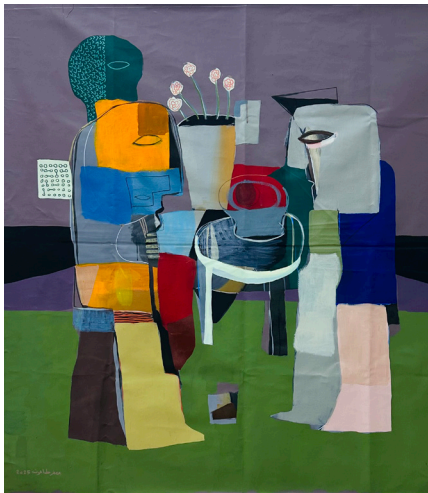
Internal Dialogue حوار داخلي 120x120 CM Acrylic on Canvas أكريلك على قماش