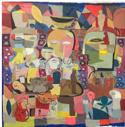
Spring ربيع 180x204 CM Acrylic on Canvas أكريلك على قماش