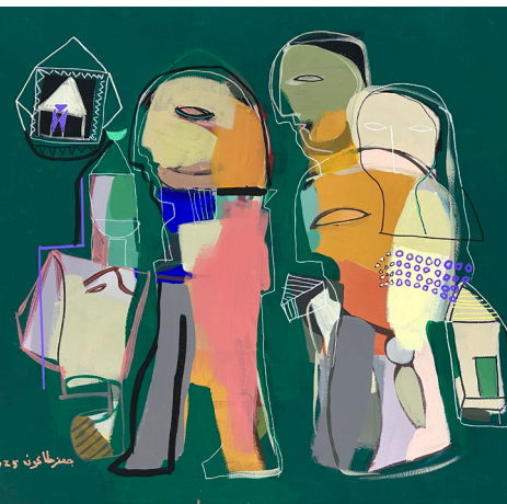
سفر Travel 60x70 CM Acrylic on Canvas أكريلك على قماش