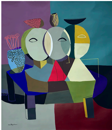
Session جلسة 130x130 CM Acrylic on Canvas أكريلك على قماش