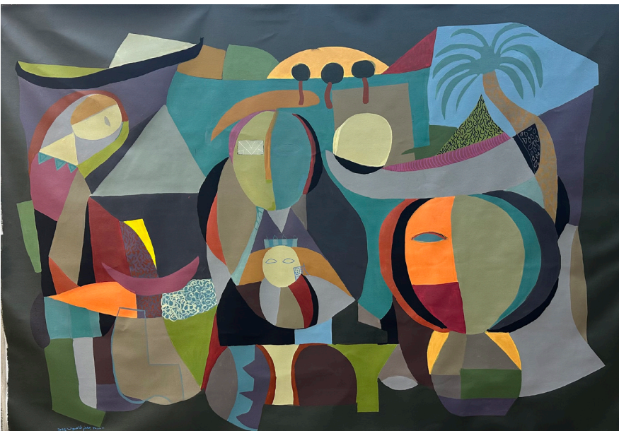
Three Trees ثلاث شجرات 159x220 CM Acrylic on Canvas أكريلك على قماش