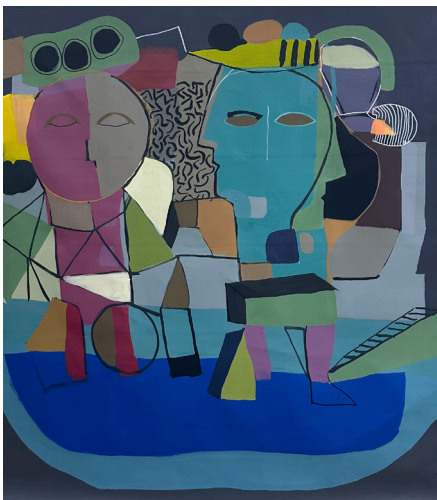
درج وماء Stairs & Water 125x125 CM Acrylic on Canvas أكريلك على قماش