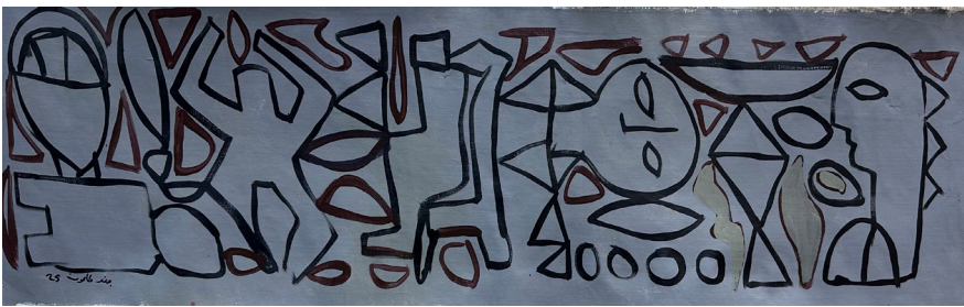
تخطيط Planning 70x24 CM Acrylic on Canvas أكريلك على قماش