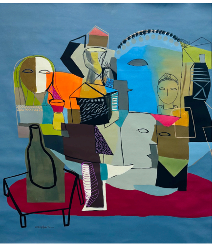
أزرق Blue 120x120 CM Acrylic on Canvas أكريلك على قماش